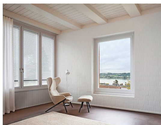
Inspirierend: Der Baukörper passt sich dem Gelände an, Fenster mit Sitznische (o.) und mit Seesicht (u.)